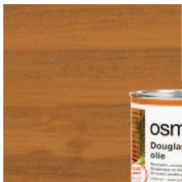
004 Douglasspar olie, naturel