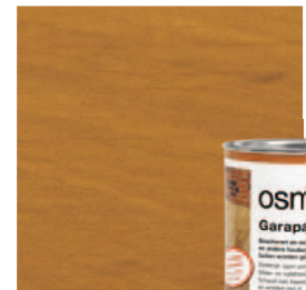
013 Garapa olie, naturel