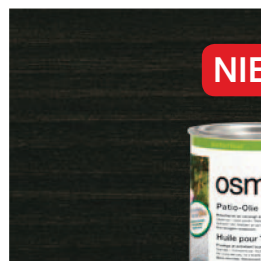
020 Terras-Olie Zwart