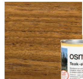
007 Teakolie, kleurloos Geen UV bescherming