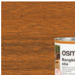
006 Bangkirai olie, naturel