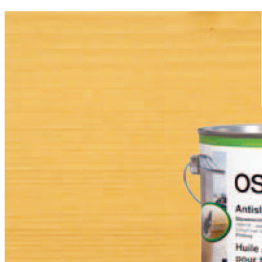
430 Antislip Terras Olie Geen UV bescherming

Opmerking: De getoonde kleurtinten zijn foto's van natuurlijke houtmonsters. De foto's staan niet garant voor de originele kleur, ze zijn een benadering hiervan. Een test op een klein stukje is aan te bevelen omdat het bereikte eindresultaat per houtsoort kan verschillen!