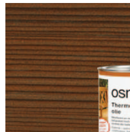
010 Thermohout olie, naturel