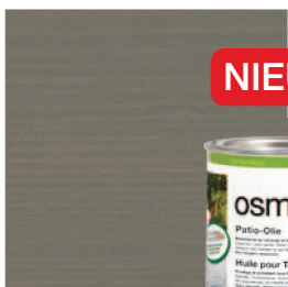
019 Terras-Olie Grijs