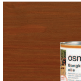
016 Bangkirai olie, donker