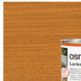
009 Lariksolie, naturel