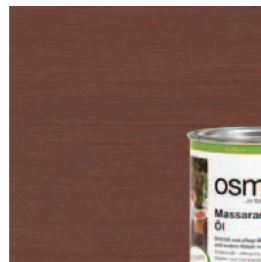
014 Massaranduba olie, naturel