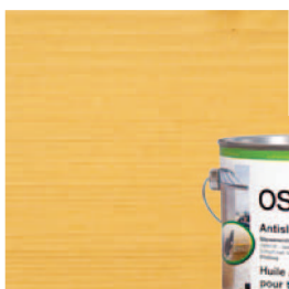
430 Antislip Terras Olie Geen UV bescherming

Opmerking: De getoonde kleurtinten zijn foto's van natuurlijke houtmonsters. De foto's staan niet garant voor de originele kleur, ze zijn een benadering hiervan. Een test op een klein stukje is aan te bevelen omdat het bereikte eindresultaat per houtsoort kan verschillen!