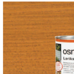
009 Lariksolie, naturel