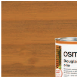
004 Douglasspar olie, naturel