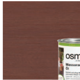
014 Massaranduba olie, naturel