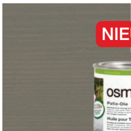
019 Terras-Olie Grijs