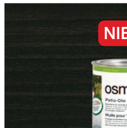
020 Terras-Olie Zwart