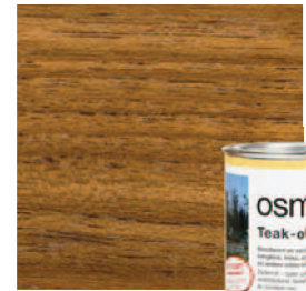
007 Teakolie, kleurloos Geen UV bescherming