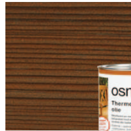
010 Thermohout olie, naturel